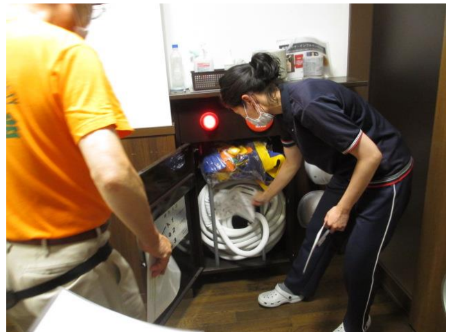
(自動火災通報設備と2号屋内消火栓の使用方法を確認)