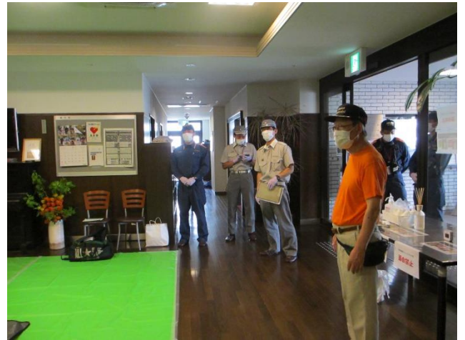
(新型コロナ対策で3密避けた訓練会場)