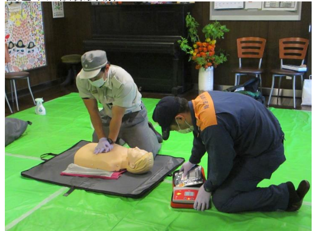
(救急隊員等から AED 操作の指導)