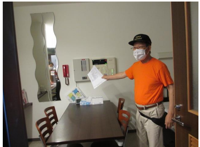
(介護職員詰め所自動火災報知設備・中継盤で現場確認と119通報)