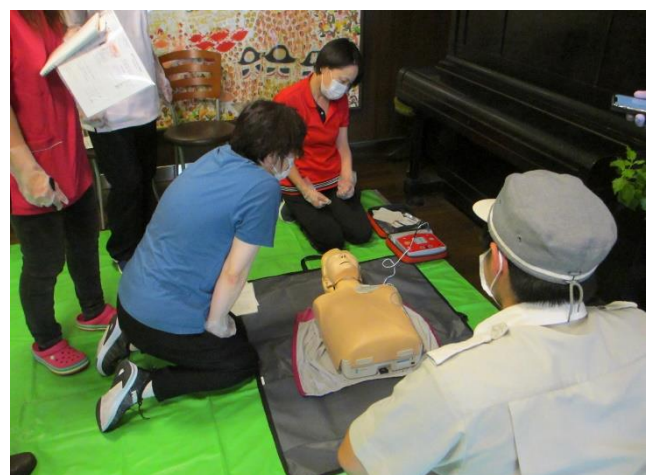
(AEDを使用した心肺蘇生法訓練を受ける介護職員等)