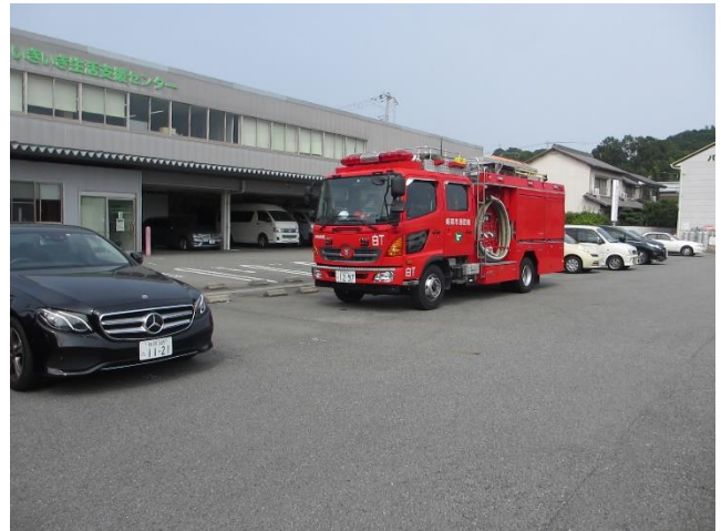
(救急隊と消防隊も訓練指導で参加)