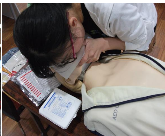
『AED体験会』『チャレンジ応急手当・三角巾』様子