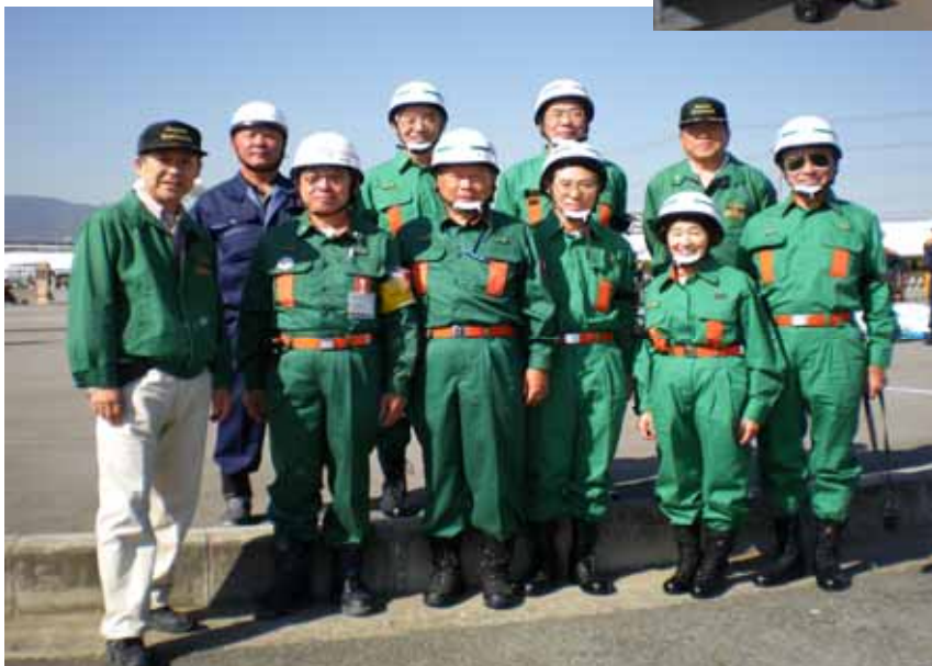
訓練を終えての記念撮影