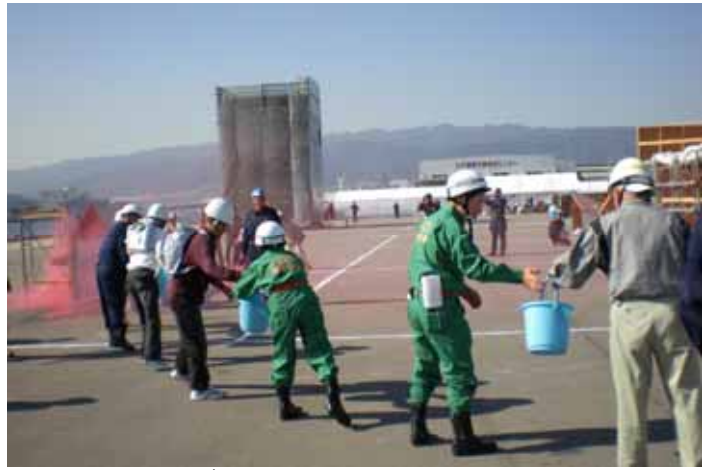
負傷者の救出訓練・初期消火訓練(バケツリレーに参加)