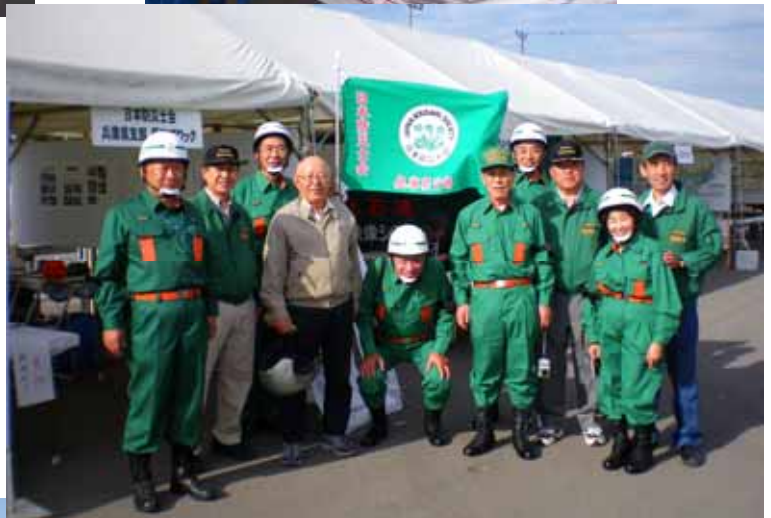
展示ブースの前で