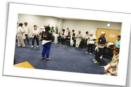
※写真は真剣に実習されている参加者の方々です。