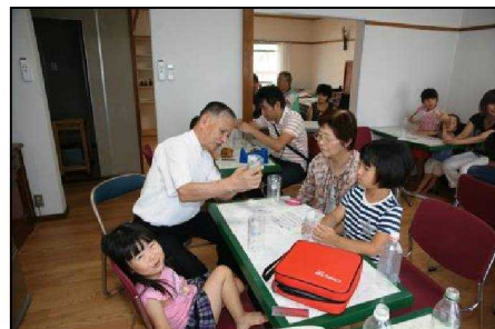
防災士指導のペットボトル雨量計