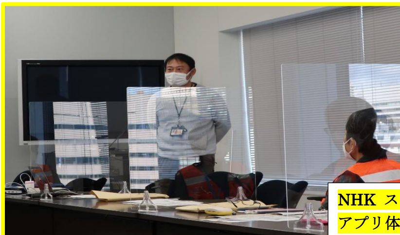
NHK スcoopボックス・防災ニュース アプリ体験 (スマートホン・タブレット対応)