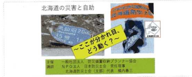
「自給のために…」防災備蓄収納講演(4/21)