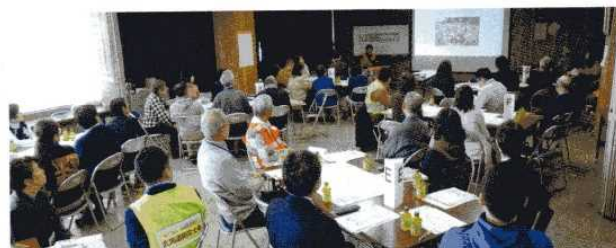
「Doはぐ」指導講演<小樽市社会福祉協議会>(2/24)