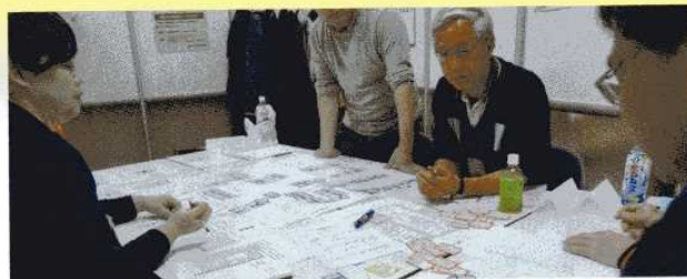
「Doはぐ」学習会<札幌市民活動サポートセンター>(2/17)