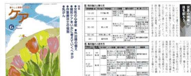
防災啓発 医療雑誌ケア掲載 6月号