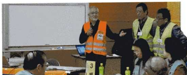
「Doはぐ」指導講演<網走市>(1/21)