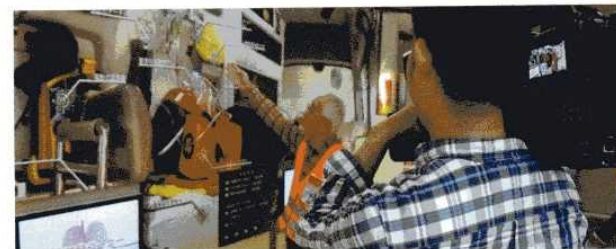
「防災週間」NHK放映<札幌市民防災センター>(1/11)