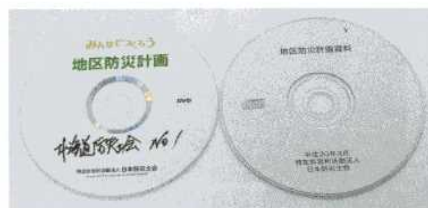
▲地区防災計画対応時貸出