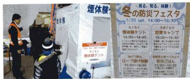
厳寒期防災体験<札幌西区・農試公園>(1/20)