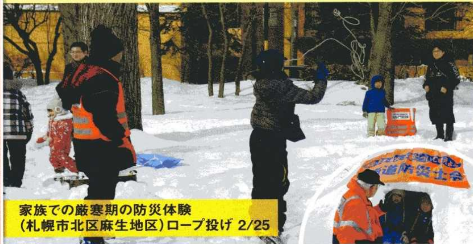
家族での厳寒期の防災体験 (札幌市北区麻生地区)ロープ投げ 2/25