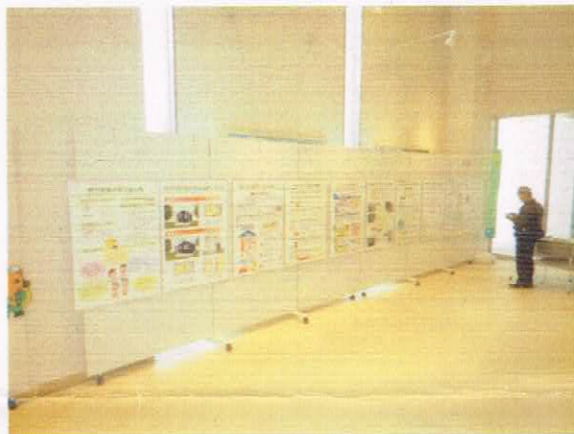
フェニックス共済PRコーナー