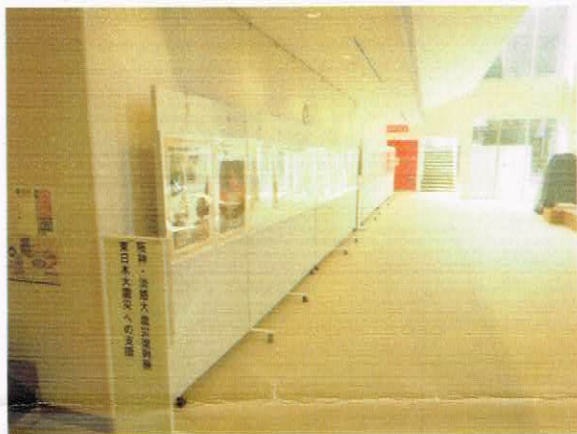
阪神・淡路大震災復興展パネル