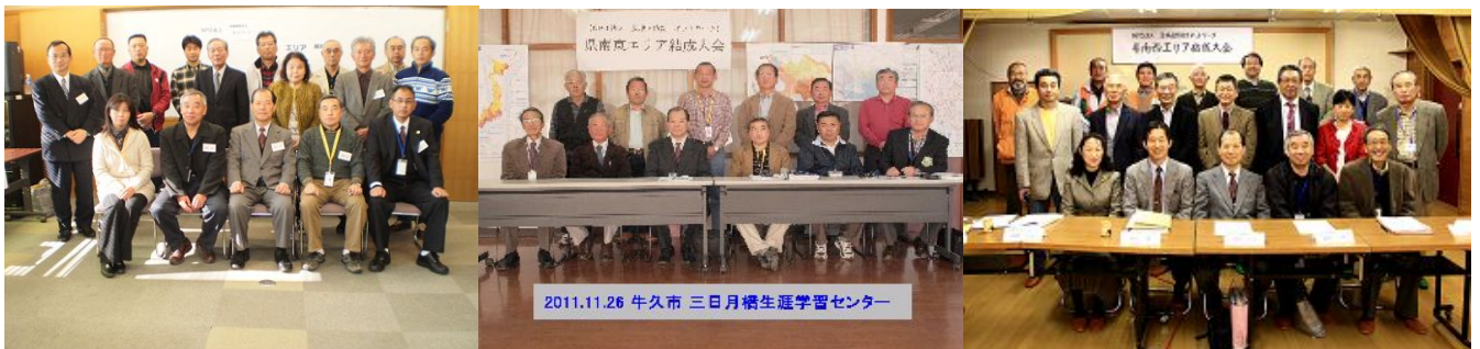
県央北エリア (H23. 12. 11)

このほど法人ではエリア制の導入とNPO法人が成立したことを受け、エリアごとに結成大会を開いた。この中で、先の設立総会で承認された上述に掲げた新組織の紹介と役員人事の確認をおこなった。また、各エリアとも会員の活動報告をはじめ展示物等の工夫が紹介され独自のエリア色がうかがえた。