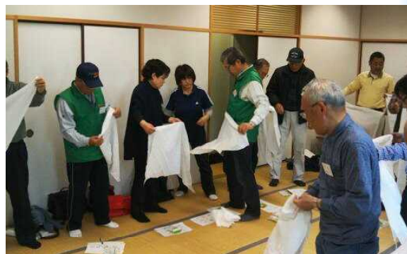
（応急手当～三角巾の使い方～）