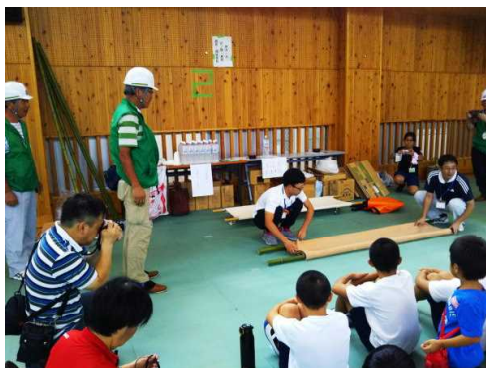
【県総合防災訓練訓練に参加】

嬉しかったのは、「防災士になりたい」と中学3年生の男子生徒の親子が訪れたり、県支部に入りたいと高校生が