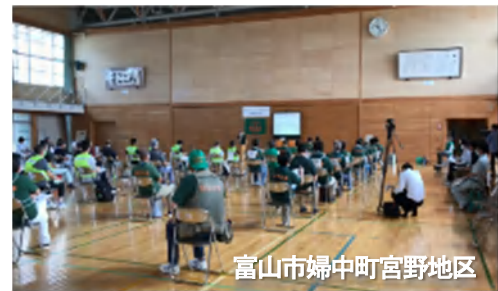
富山市婦中町宮野地区

避難所の開設といえば、まず「受付」ですが、通常の受付の前に、事前受付を設けました。この事前