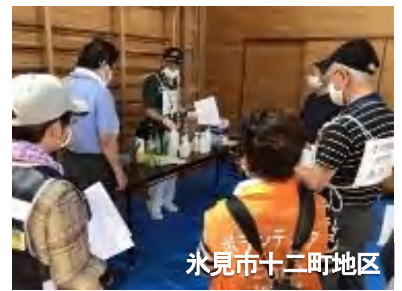
氷見市十二町地区

避難所ではマスク着用は当然ですが、緊急時は一時的にアルコール消毒液が不足することも想定されますので、消毒液である次亜塩素酸ナトリウム液の希釈の仕方の訓練も実施しました。