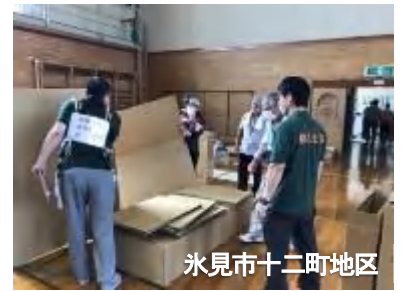
氷見市十二町地区

避難所の収容人数には制限があります。感染症対策として、一人の専有面積を従来の2㎡から4㎡程度にすると、収容可能人数が大幅に低下します。そこで、段ボールベッドとパーティションにより、ある程度収容能力が改善できますが、それでも限界があります。指定避難所の運営等に関し、防災士としてさらに研究すべき課題も多いと思われます。