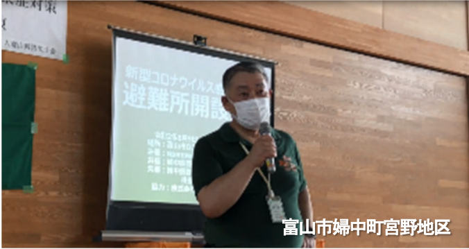
富山市婦中町宮野地区

新型コロナウイルス感染症が流行している状況下では災害時の避難や避難所における感染症対策が急務の課題です。内閣府では、4月1日より「避難所における新型コロナウイルス感染症への対応について」等、逐次、通達等を発令しています。