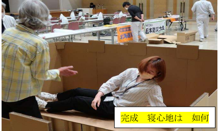
完成 寝心地は 如何