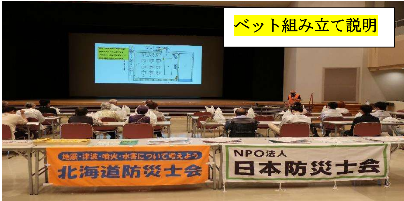
ベット組み立て説明