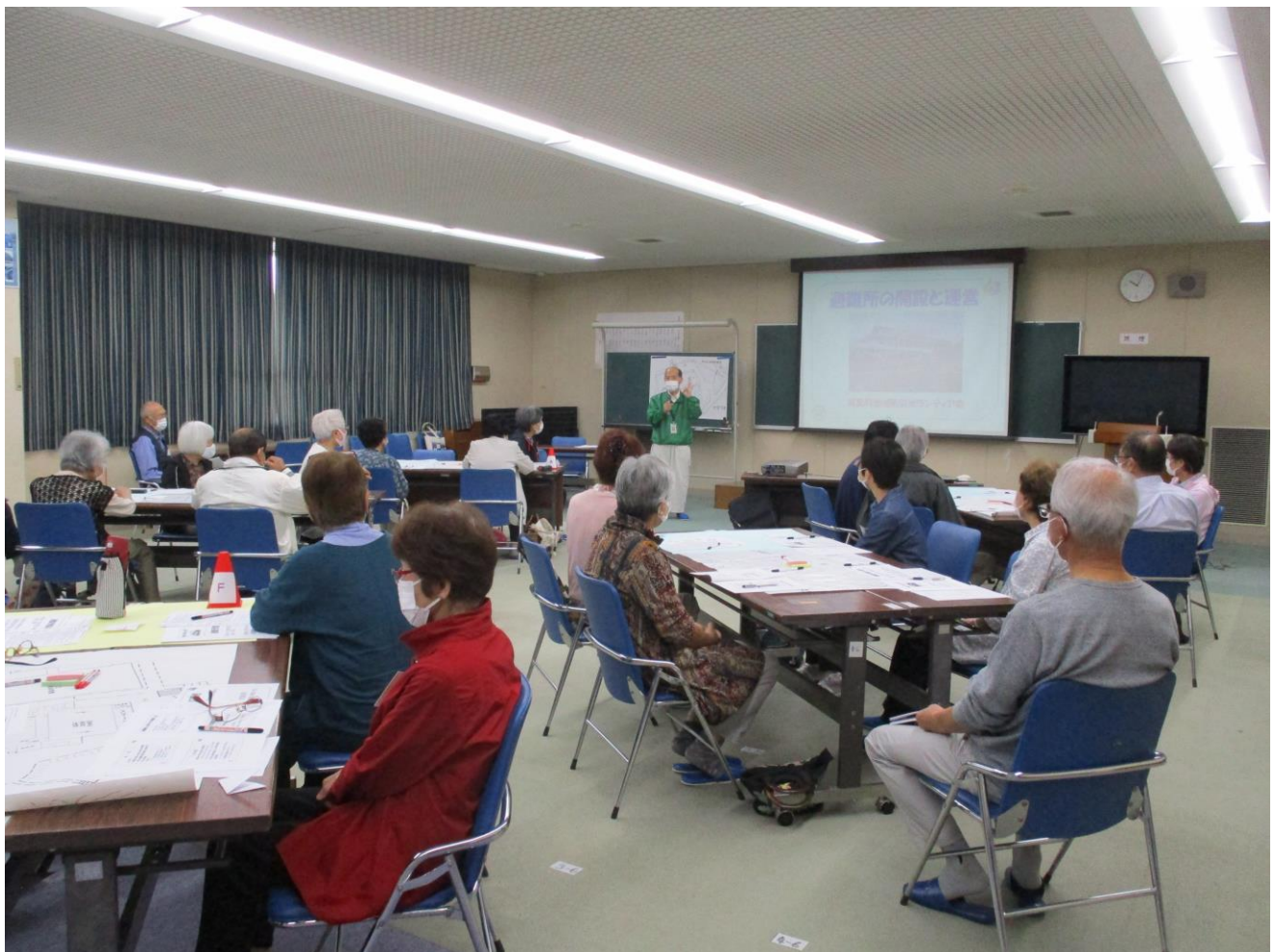
避難所に関する基礎知識の学習風景