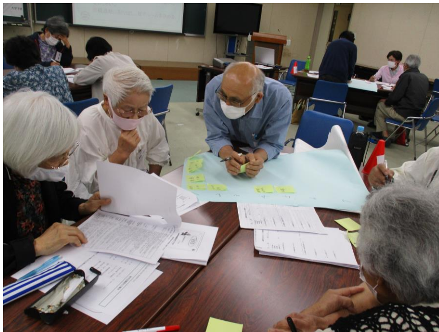
ワークショップ2「避難所生活のルール作り」研修風景