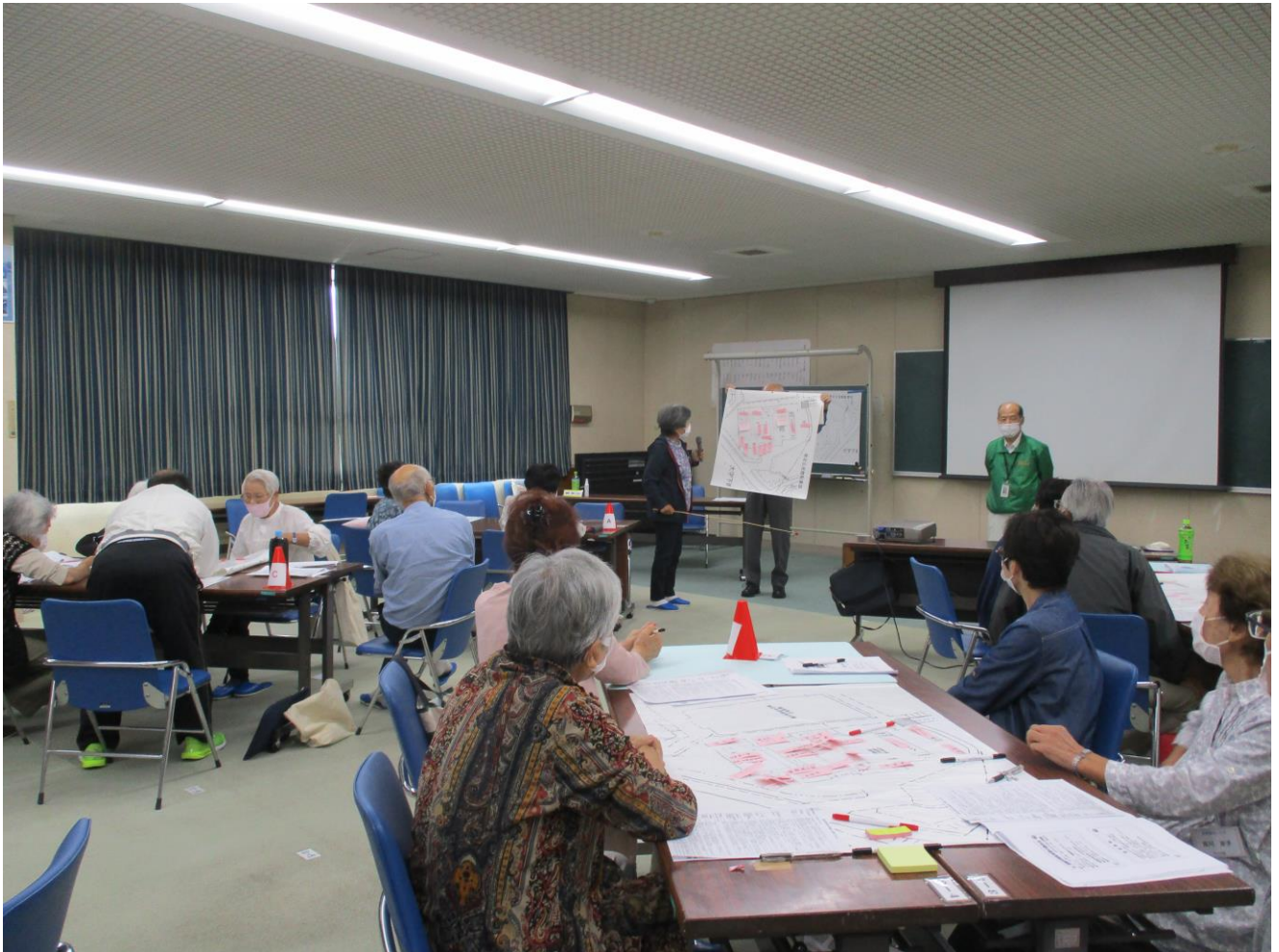
ワークショップ1「避難所の部屋割り(案)」発表風景(各班毎)