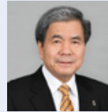
蒲島 郁夫 熊本県知事