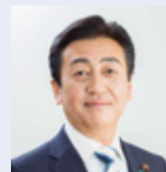
星野 剛士 国土強靱化担当副大臣