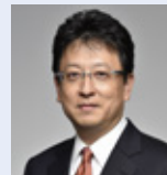
大西 一史 熊本市長