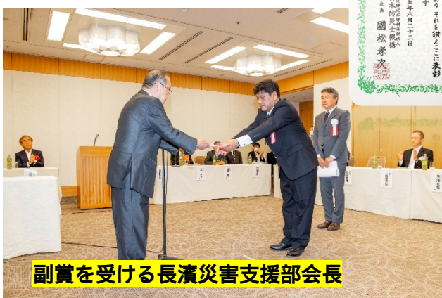
副賞を受ける長濱災害支援部会長