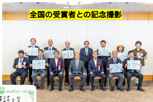
全国の受賞者との記念撮影