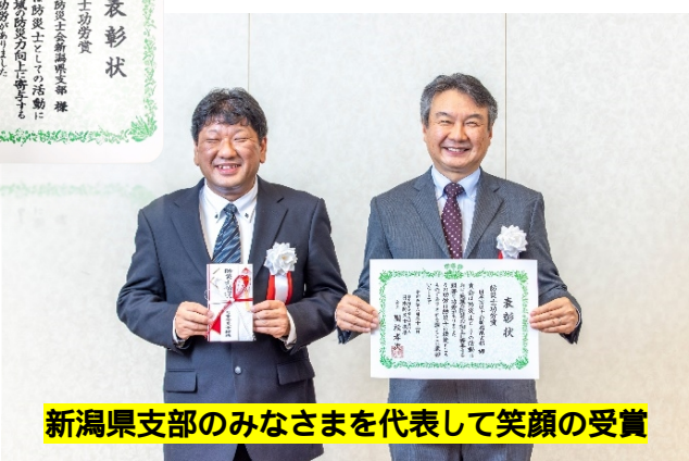
新潟県支部のみなさまを代表して笑顔の受賞