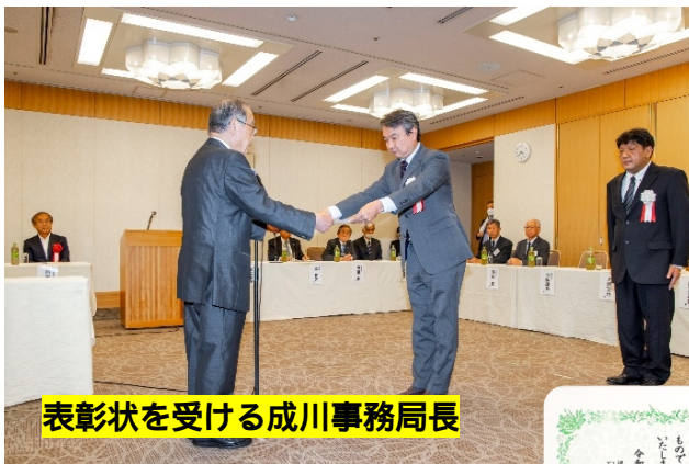
表彰状を受ける成川事務局長