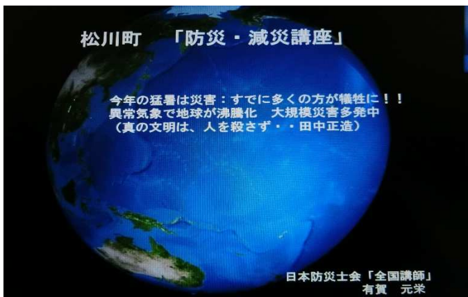
③講師担当 タイトル