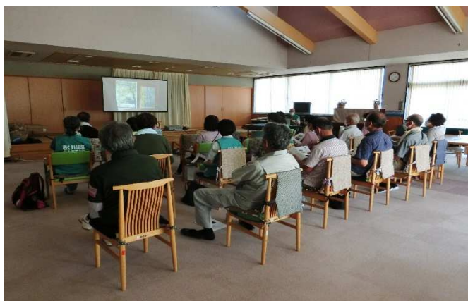
講座は隣接の社会福祉協議会にて