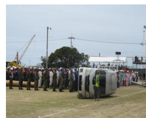
テントブースでの防災グッズ作成の様子(左)と大規模災害を想定した訓練風景(右)