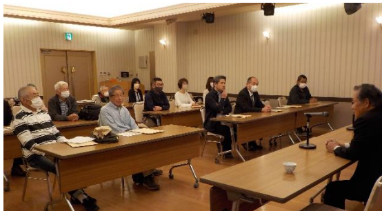
定期総会 参加者の面々

令和5年4月22日、高知会館にて令和5年度定期総会を開催しました。令和4年度の事業報告、決算報告及び、令和5年度の事業計画案、予算案等が審議され、いずれも承認されました。総会終了後、スキルアップ研修を実施しました。