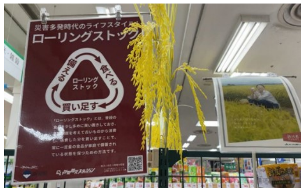
店頭でのポスター等の展示

スーパーやコンビニ、食品メーカーなどの企業の皆さんと連携して家庭備蓄の向上とローリングストックの普及を目指すために10月から実施されているローリングストック普及キャンペーンに合わせて、地域や学校などでもローリングストックの普及啓発を行い、家庭の防災力の向上につなげていきます。