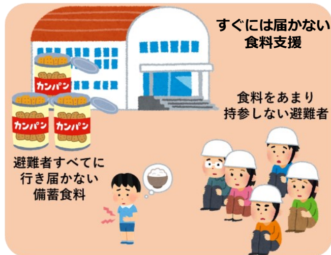
【現状】発災直後に食料が十分に 行き届かない避難所

炊き出しや食料支援が届くまでの間、避難先でレトルト食品やパックご飯を温めて食べられるように、IHや鍋の整備を進めたり、訓練の際に住民の皆さんにレトルト食品などの持参を促すことで、発災直後でも食に困らない環境整備を図ります。