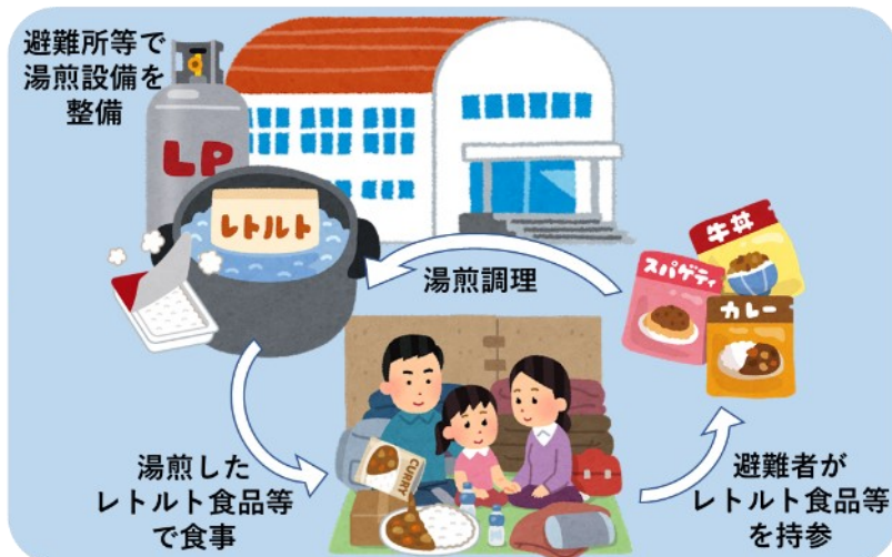
【目指す姿】避難者持参のレトルト食品等を 避難先で温めて食べられる

参考URL； https://hinanjoyusen.hp.peraichi.com/