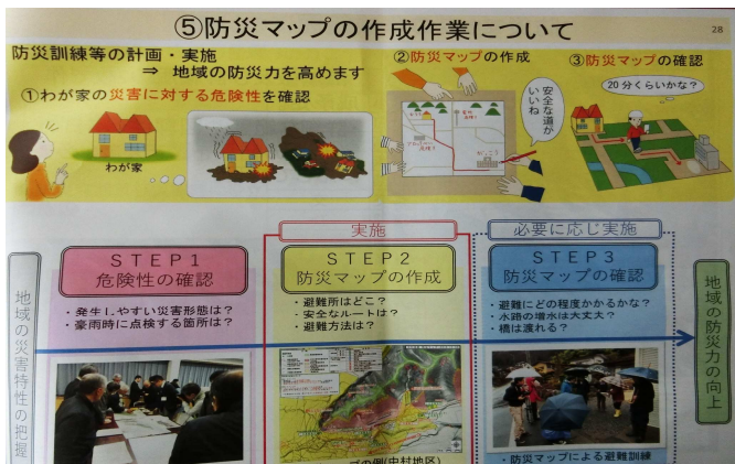
防災マップの作成