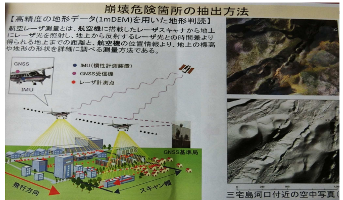
危険ヶ所の抽出方法の説明を受けます