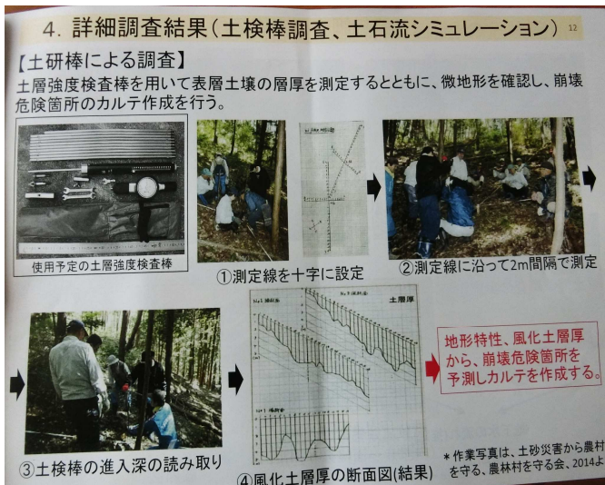
調査方法について