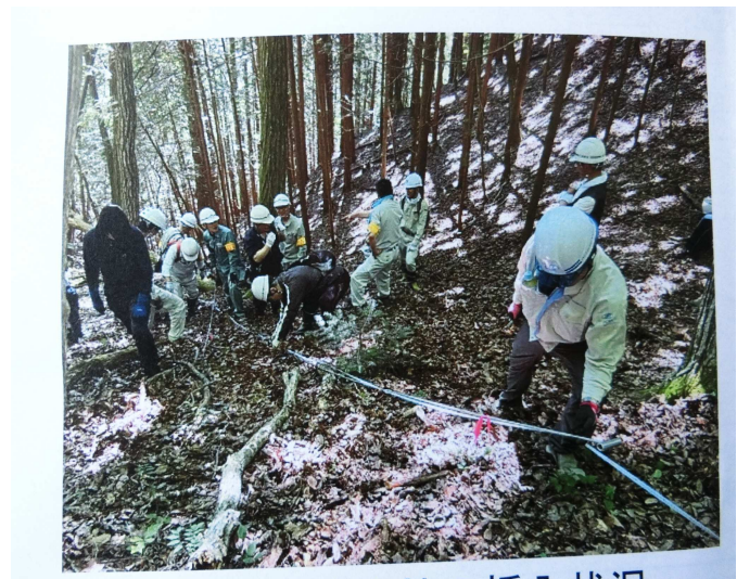
住民も調査に参加し、自分の目で確かめます