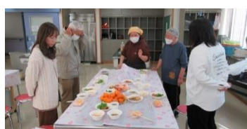
「昼食は災害時でも「通常食に近いものを」

会員に限定せず、参加の出入り時間自由のスキルアップ研修会を開催しました。午前には県南海トラフ地震対策課による「事前復興まちづくり計画」について、続いて会員作成の「ちよいむず防災クイズ」を実施しました。午後は県警本部災害対策課による「災害時の備え」の実技と、会員によるチャレンジ研修の発表の場としました。多くの方のご参加をいただきました。(令和5年12月2日)