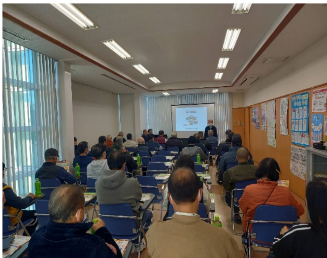
DVD上映・講話等の風景

尚、当日の参加者は、3団体で合計42名でした。 参加者の声 に「本日の訓練内容をいざの時に、命を守る行動に活かしたい。」「今回の様な啓発活動や火災訓練は、せめて1年に1回は実施すると良いと思います。」等とあり、企画実施する立場としては、嬉しく・励みになりました。