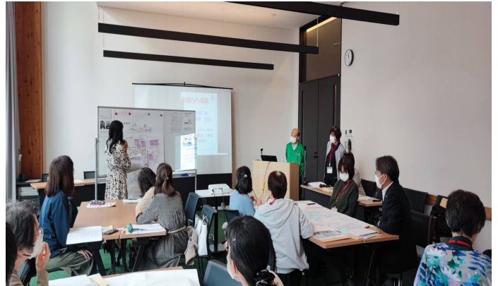
各グループ代表の発表風景

参加者からの声として、アンケートでは、当研修会について「とても良かった」「良かった」と16名(94.1%)が回答。「なかなか避難所について考える事もなかったので、とても勉強になり、もし災害の起きた場合にどうすれば良いか参考になった。」「避難所について、具体的に考える事で、とても勉強になりました。自助・共助に務めたいと思います。」等の声も寄せられた。